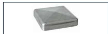
An den Torpfosten kommen jetzt Alu-Kappen zum Einsatz