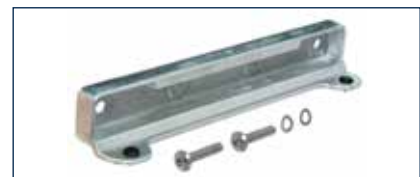
Der passgenaue Anschlag sorgt für höchste Schließgenauigkeit