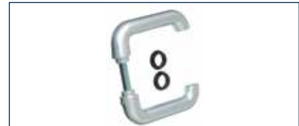
Die neue hochwertige Alu-Drückergarnitur passt optisch perfekt zum Multi-Tor