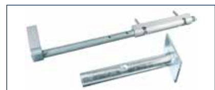
Auch Bodenriegel und -hülse* werden jetzt in Industrie-Qualität geliefert