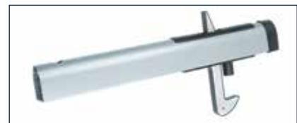
Der Torflügelsteller* für das Multi-Tor stammt vom Industrie-Tor