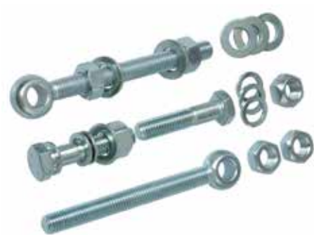
Sehr stabile Torbänder mit Augenschrauben versehen das Multi-Tor auf