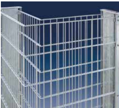
Ecklösung im 90°-Winkel

RANKO Steinmauern bestehen zum einen aus Steinmauerpfählen. Diese sind als Typ 120 oder Typ 140 erhältlich. Folglich besitzt die RANKO Steinmauer innen eine Tiefe von ca. 140 bzw. 160 mm. Dieses optimierte Maß sorgt dafür, dass im Vergleich zu herkömmlichen Gabionen deutlich weniger Steine benötigt und so Kosten gespart werden. Stabilität erhält die RANKO Steinmauer durch die feuerverzinkten Doppelstabmatten vom Typ 8/6/8 sowie durch Profilrohrpfähle mit beidseitigen Profilschienen und Aluauflegeböcken, die vor der Montage einbetoniert werden. Ein „Ausbauchen“ wird durch den Einsatz von Schraubspannern vermieden, die als Zubehör erhältlich sind.