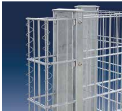
Anfangs- bzw. Endstück

Mit der Ecklösung und dem Anfangs-/Endstück passt sich die RANKO Steinmauer flexibel jeder Gegebenheit an.